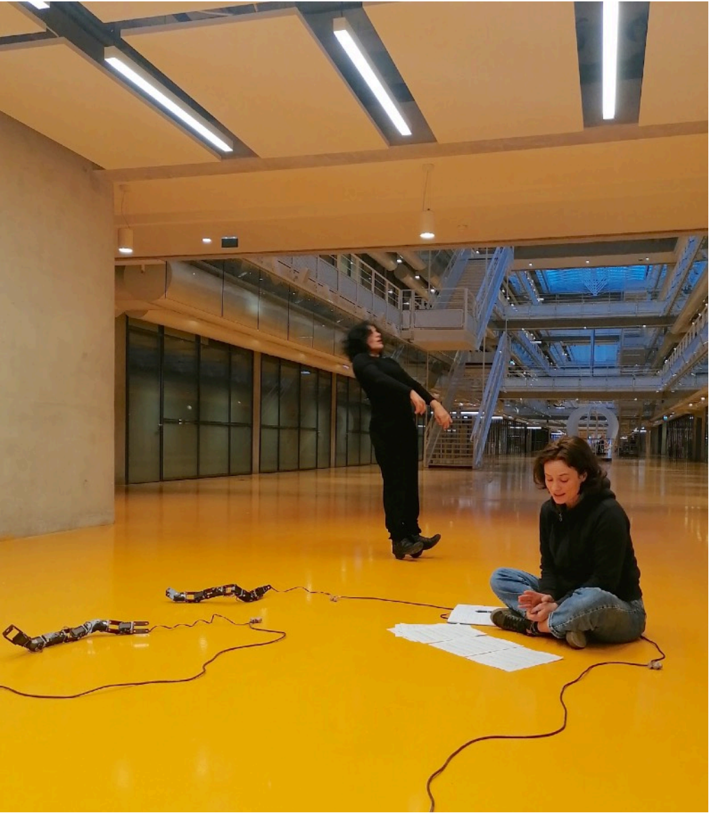
Scène du puits Lascaux (-18000 BP)