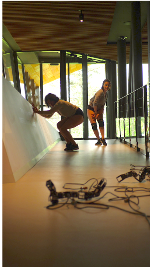
Corps en jeu avec les robots. résidence au Musée archéologique du Lac de Paladru (Isère), mai 2023