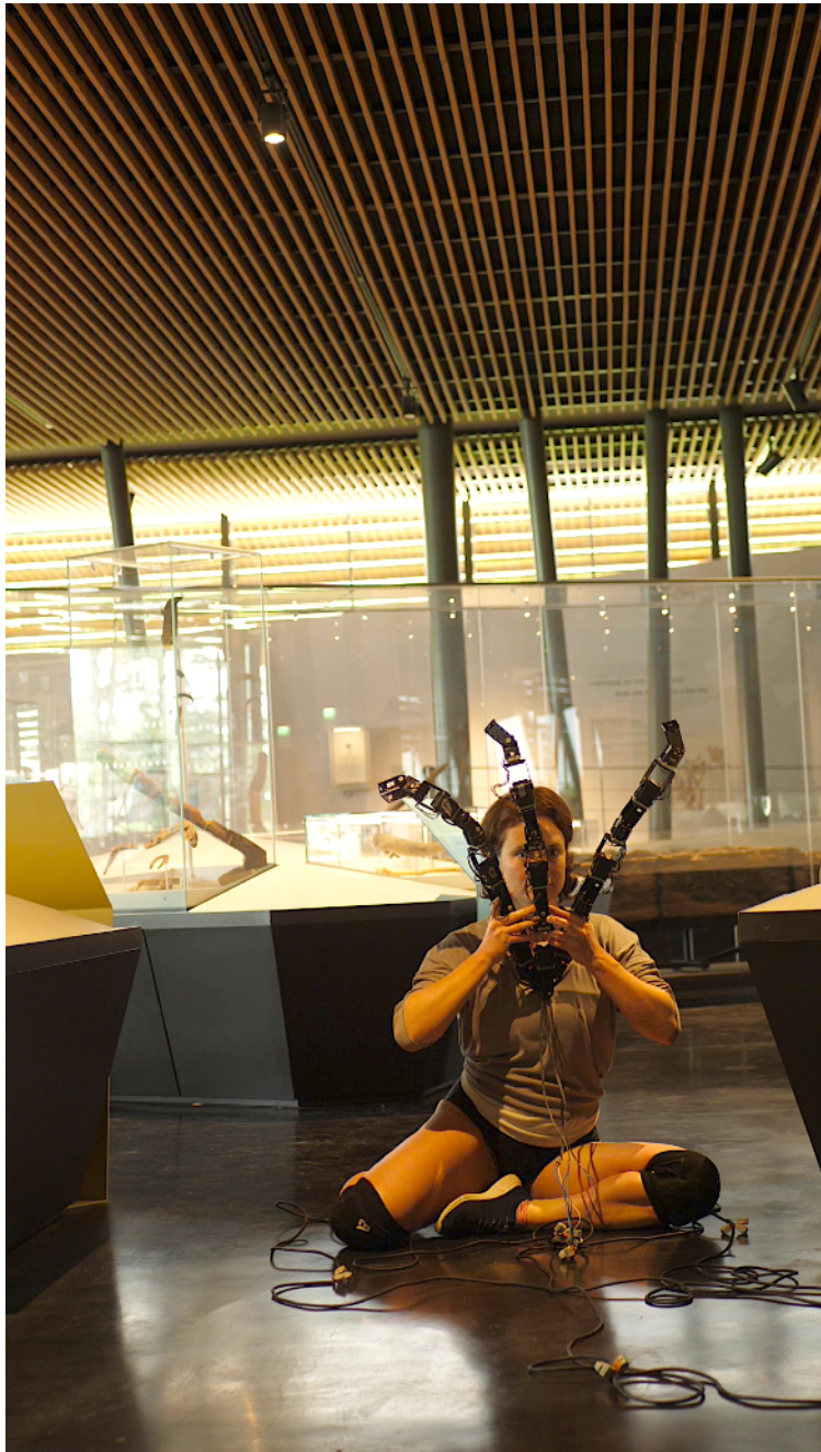
Figure hybride. résidence au Musée archéologique du Lac de Paladru (Isère), mai 2023

Thérianthropes (figures hybrides humains/animaux) Étiolles Les Trois Frères Massat Altamira