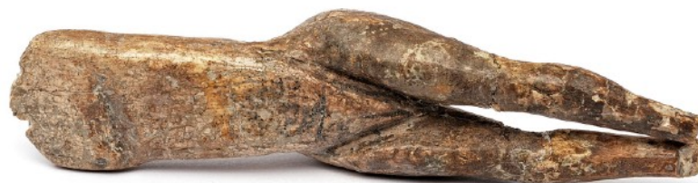
Vénus « impudique » (Magdalénien)