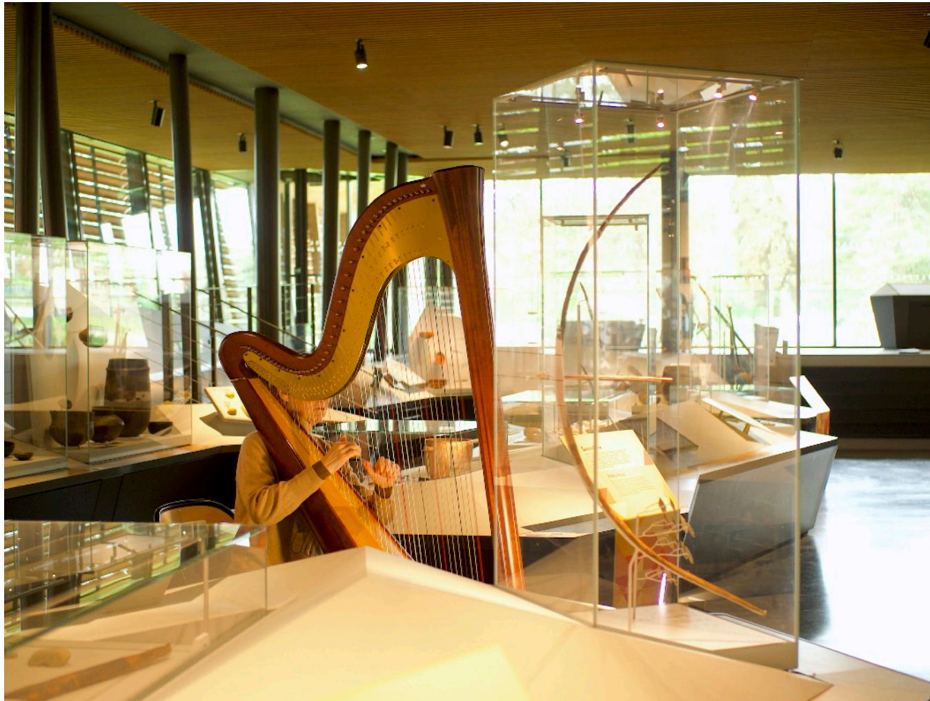
Harpe confrontée à un arc. résidence au Musée archéologique du Lac de Paladru (Isère), mai 2023